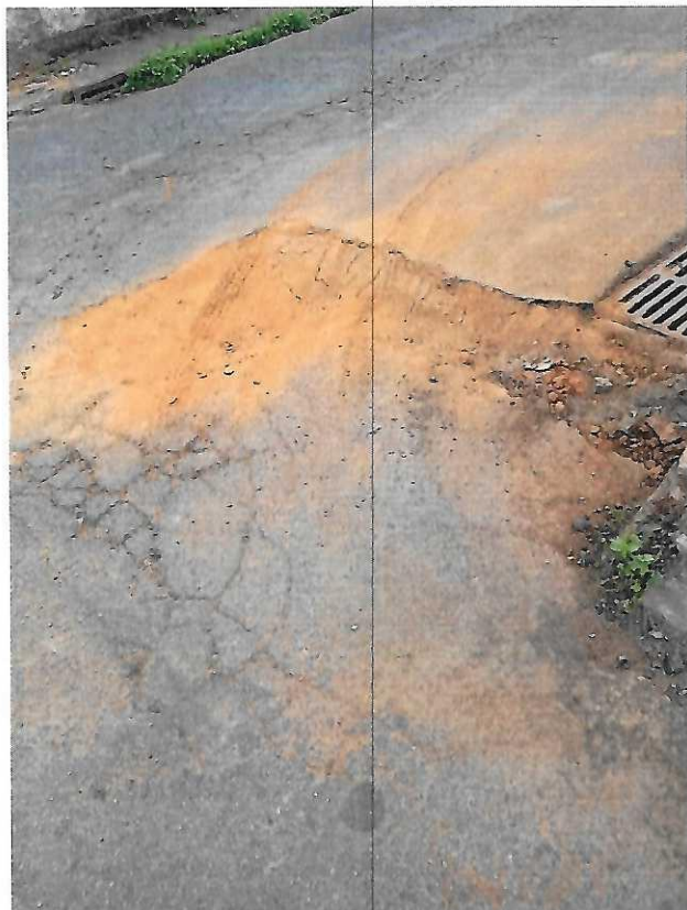
064-Tapa buraco rua Amramndo Batista