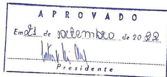
GERALDO CAMILO LELES PONTES Vereador Leles Pontes - REPUBLICANOS

Sala de Sessões da Câmara, 14 de setembro de 2022.