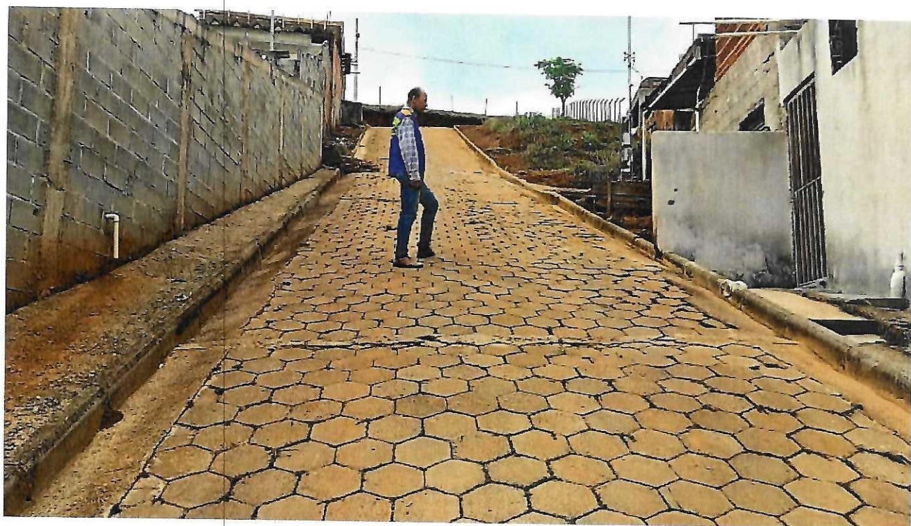
Rua Eni leite