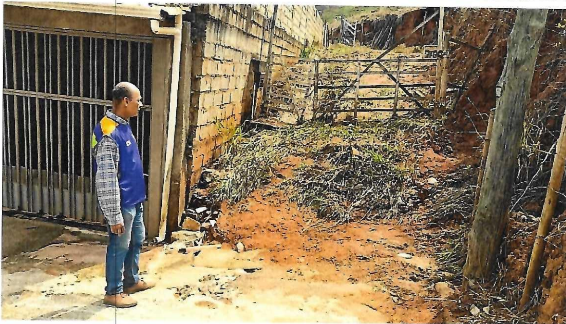
Grelha coletora rua Sebastião Avelino da Costa