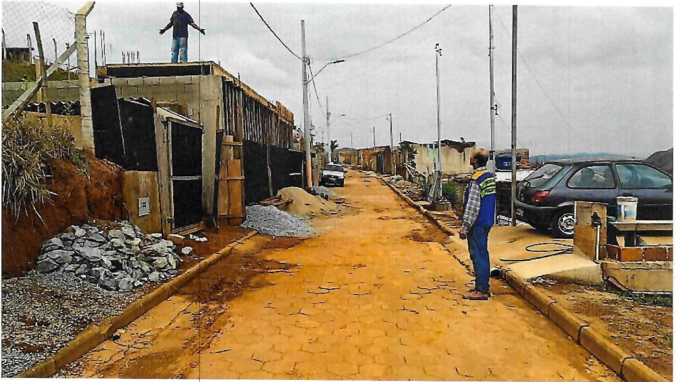
Rua Ítalo de Sales Nunes